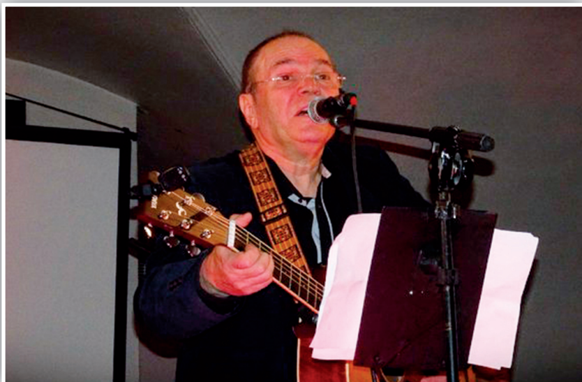
Koncert Jerzego Filara.