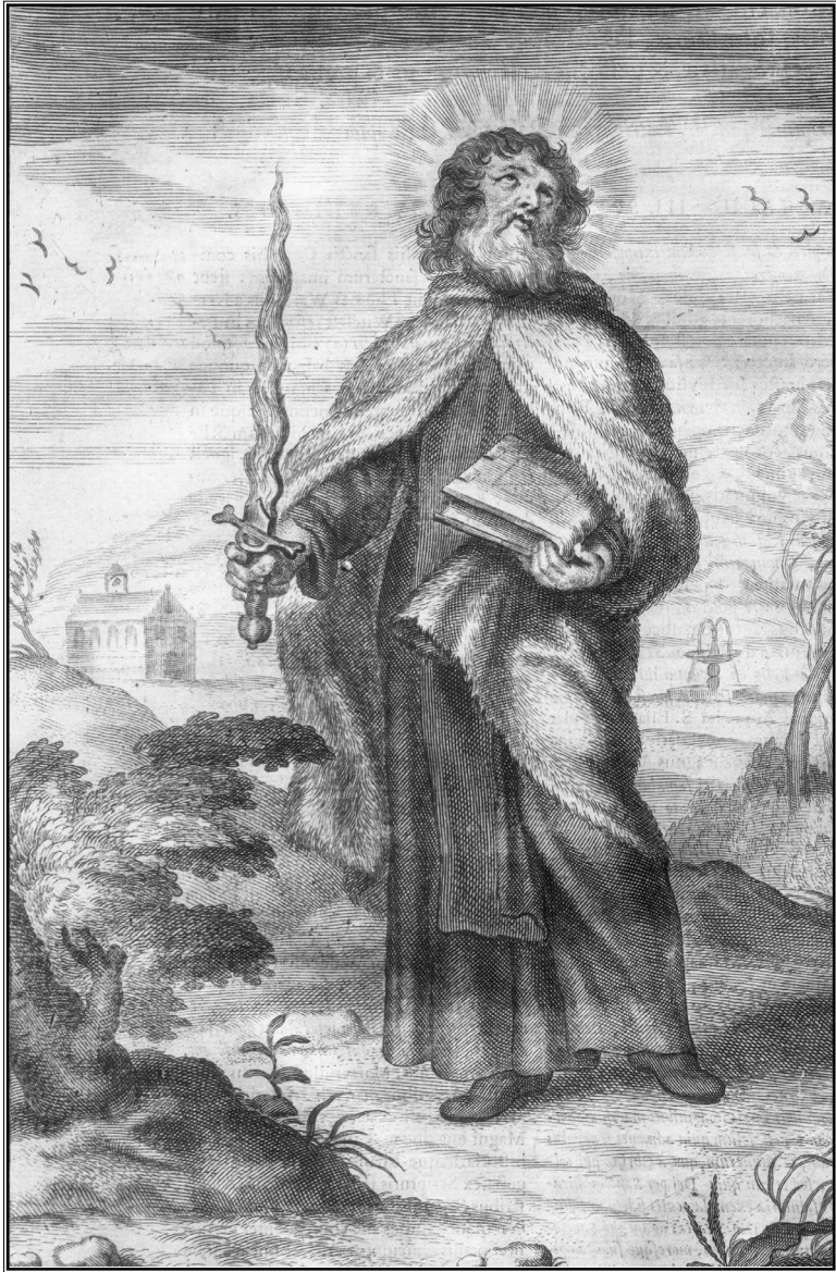
Oto Eliasz , prorok jak ogień, a słowo jego płonęło jak pochodnia (Syr 48,1), przezacny Patriarcha, najświętszy Prorok, pierwszy Mnich, twórca życia zakonnego, prekursor czci Bożej Rodzicielki.